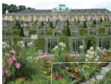
POTSDAM PAUL GEERTS