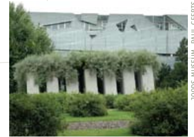
JOODS MUSEUM, PAUL GEERTS

Geen stad in Europa heeft zoveel groen als Berlijn: meer dan een derde van de stad bestaat uit bossen, velden en meren, en dan hebben we het nog niet over de talrijke parken, plantsoenen, lanen en tuinen. Berlijn is sinds de val van de Muur een echt architectuurlaboratorium waar de bekendste architecten ter wereld met elkaar wedijveren om het grootste, spectaculairste, duurste... gebouw te realiseren. Ook op het vlak van de tuinarchitectuur is Berlijn een echt laboratorium waar bekende ontwerpers uit de hele wereld actief zijn. Maar Berlijn is niet alleen een stad van de toekomst, het heeft ook een rijk en soms bewogen verleden. Ook dat verleden komt uitgebreid aan bod: het Berlijn van de keizerlijke paleizen en parken, van Barok en Bauhaus, van de Jodenvervolging en van de Muur. Levend groen vormt het bindteken dat alles met alles verzoent.