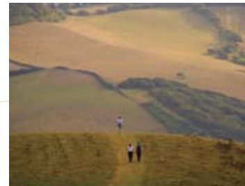
PAD NAAR THORNECOMBE BEACON